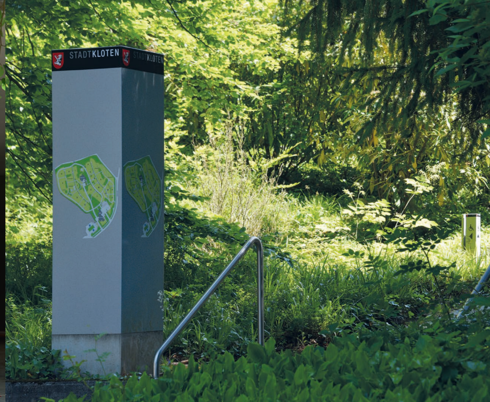
Stadt Kloten, Friedhof Chloos