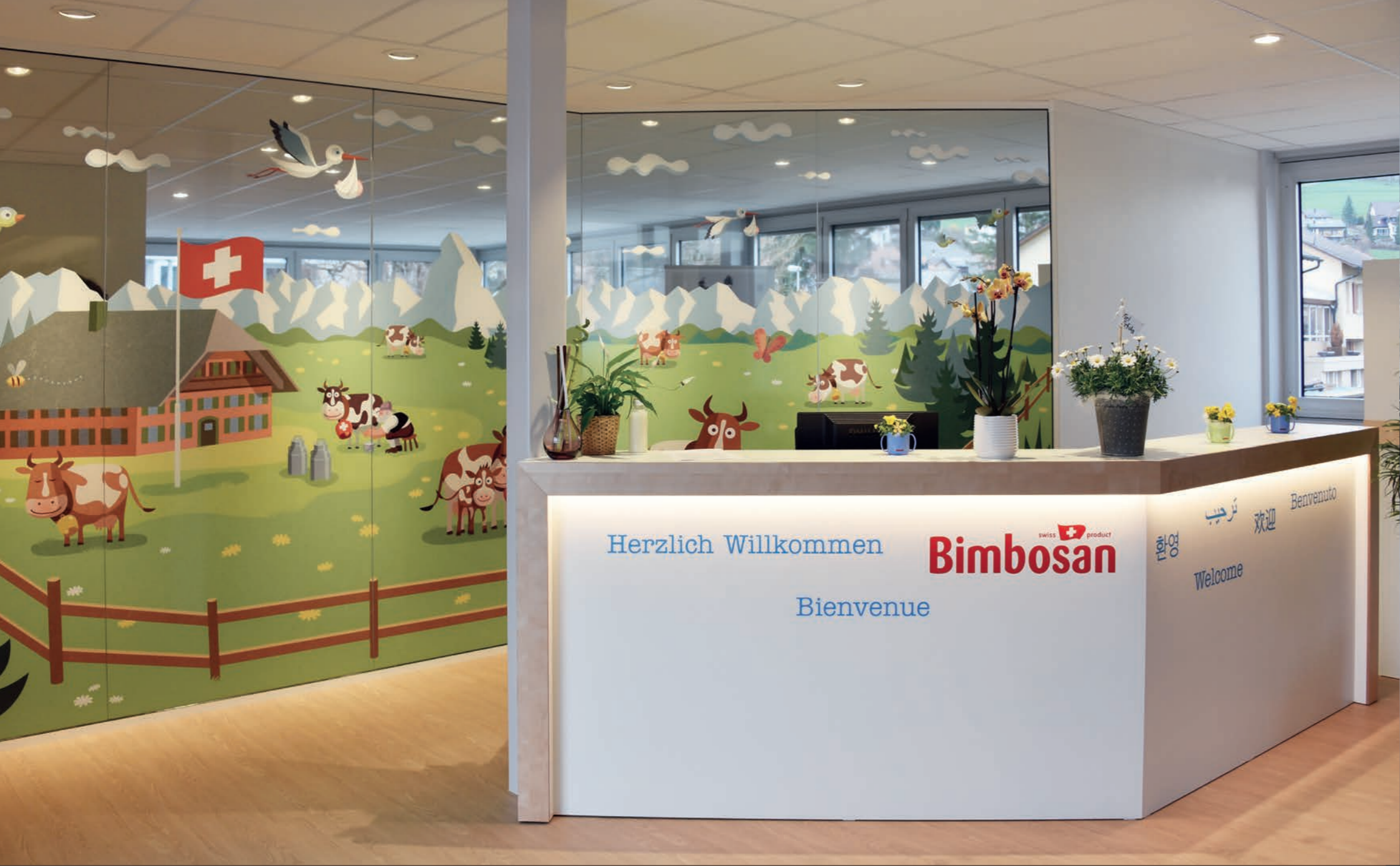
Bimbosan AG Raumteiler aus foliertem Glas trennt die grosszügigen Büros vom Empfang.