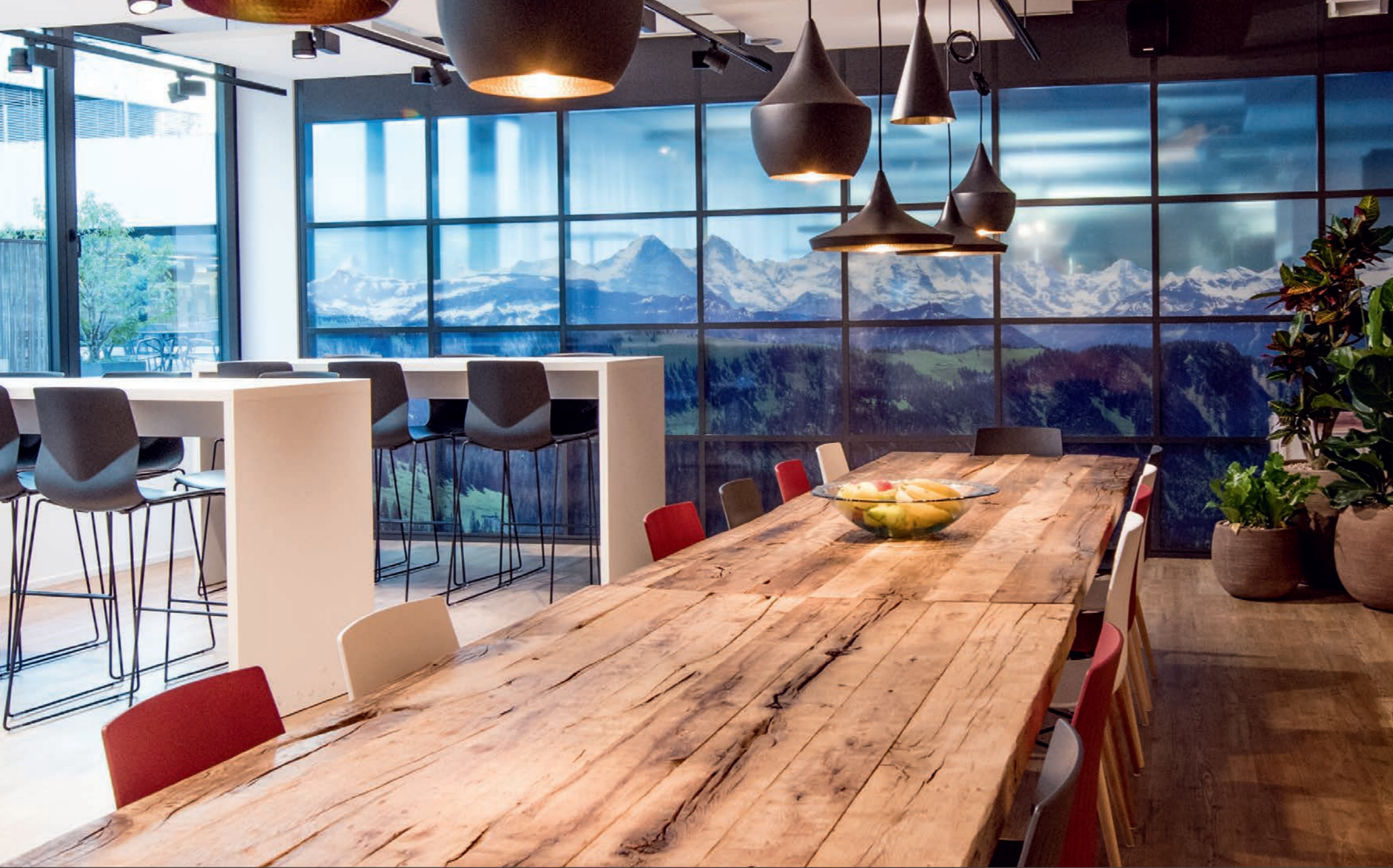
Avectris Frontwork erstellte das Grundkonzept für die Wandbebilderung und die Raumtrenner aus Glas.